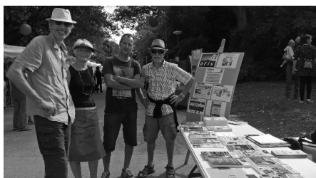
Forum des associations Marseille - 8 Septembre 2018