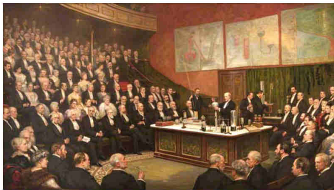
Présentation de Sir James Dewar à la Royal Institution sur l'hydrogène liquide. Henry Jamyn Brooks (1839-1925)