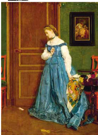
L'Hésitation, Alfred Stevens (1823-1906)

Dans cet article, nous abordons la question des doses de radioactivité subies par les populations et leur impact sanitaire. Nous ne discutons pas le cas des personnels militaires et civils employés dans le cadre des campagnes, alors que certains ont reçu des doses plus importantes, en particulier les pilotes d'avions chargés de sonder le panache à la suite d'une explosion. Deux sources d'information principales ont été utilisées : une analyse réalisée en 2006 par le CEA [3], à la demande du ministère de la Défense et suivant une méthodologie approuvée par l'Agence internationale de l'énergie atomique (IAEA), et une expertise collective de l'Inserm réalisée en 2021 [4].